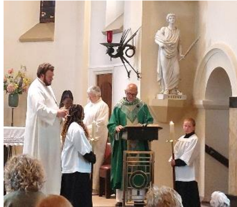
Het Locatieteam Vitus

Wij wensen alle betrokkenen heel veel heil en zegen in hun nieuwe werkring en zijn hen erg dankbaar voor hun grote inzet voor onze parochie.